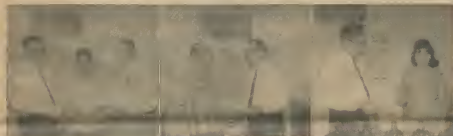
3. LUCIO MADURO (Centro) Bubali 28, Noord